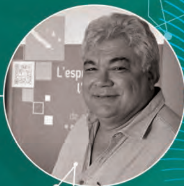
#Daniel OCHIDA Président du MEDEF-NC

En tant qu'organisation patronale représentative et avec l'appui du MEDEF national, nous avons initié un programme d'actions ambitieux depuis 2016 pour accompagner les entreprises calédoniennes dans leur transformation digitale. Fort du succès rencontré par les actions de ce programme avec Innolab (2017) et la première édition de Diginova (2018), nous réitérons ce grand temps fort en lui donnant une dimension plus importante et un rayonnement à l'international.